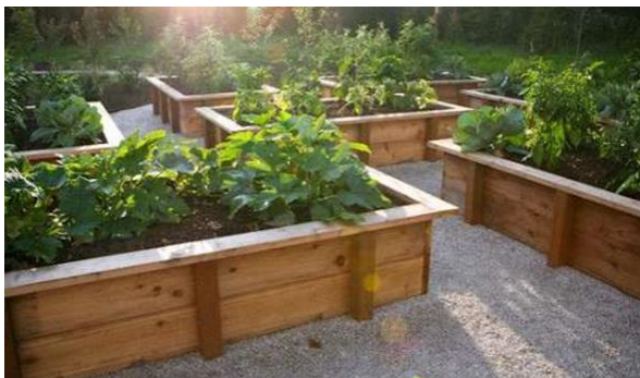
Ilustračná fotka o úžitkovej záhrade

Výchovné prvky budú umiestnené v lužnom lese. Pre účely náučného chodníka sa vytvoria rôzne informačné a interaktívne tabule, ktoré predstavia dreviny a živočíchy žijúce v tomto lese. Na inštaláciách znázorňujúce kmene drevín predstavíme 5 rôznych typov drevín.