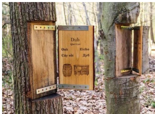
Plán inštalácie kmení drevín

Informačné tabule a exteriérové interaktívne prvky umiestnené pozdĺž lesnej prechádzkovej trasy upozornia okolo idúcich na flóru a faunu lesa a na jeho hodnoty. Pri ceste smerom od hrádze poukážeme na zaujímavosti niekdajšieho lesného hospodárenia. Pešia trasa zahŕňa amfiteáter, ktorý v súčasnosti funguje ako priestor pre rôzne eventy a aktivity usporiadané v obci. Pri rieke sa zriadi drevená oddychová zóna.