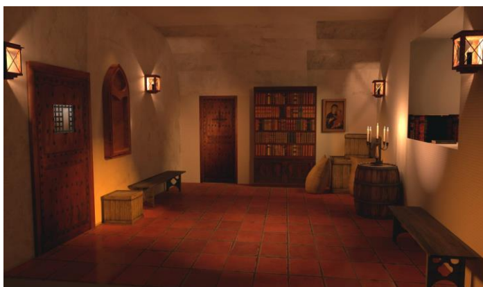
Vizuál únikovej izby

vybuduje v objekte kaštieľa tzv. escape room / úniková izba, čiastočne financované z projektu Interreg.