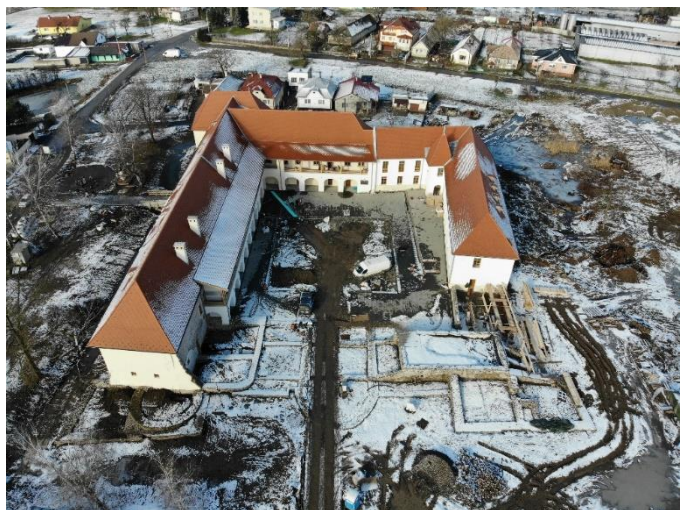
Kaštieľ fotený z drónu, 2021

Nezisková organizácia II. Rákóczi Ferenc implementujúca obnovu kaštieľa v Borši v spolupráci so samosprávou mesta Sátoraljaújhely podala projekt v decembri 2019 v programe Interreg SKHU/1902 v prioritnej osi Príroda a kultúra - zvýšenie atraktivity prihraničnej oblasti pomocou rozvíjania spoločných turistických atrakcií. Program realizovaný s podporou Európskeho fondu regionálneho rozvoja ( www.skhu.eu ) vytvára priestor na úspešnú spoluprácu v prihraničných regiónoch.